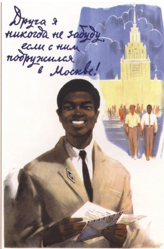
Советский плакат, 1964

Есть в русском фольклоре целый слой анекдотов об иностранцах в России, обыгрывающих разницу менталитетов. Вот мой фаворит. В ЦРУ подготовили высококвалифицированного шпиона, обучили его русскому языку и забросили в Россию. Вышел шпион из лесу, подошел к избушке, дай, говорит, бабушка, молока напиться.