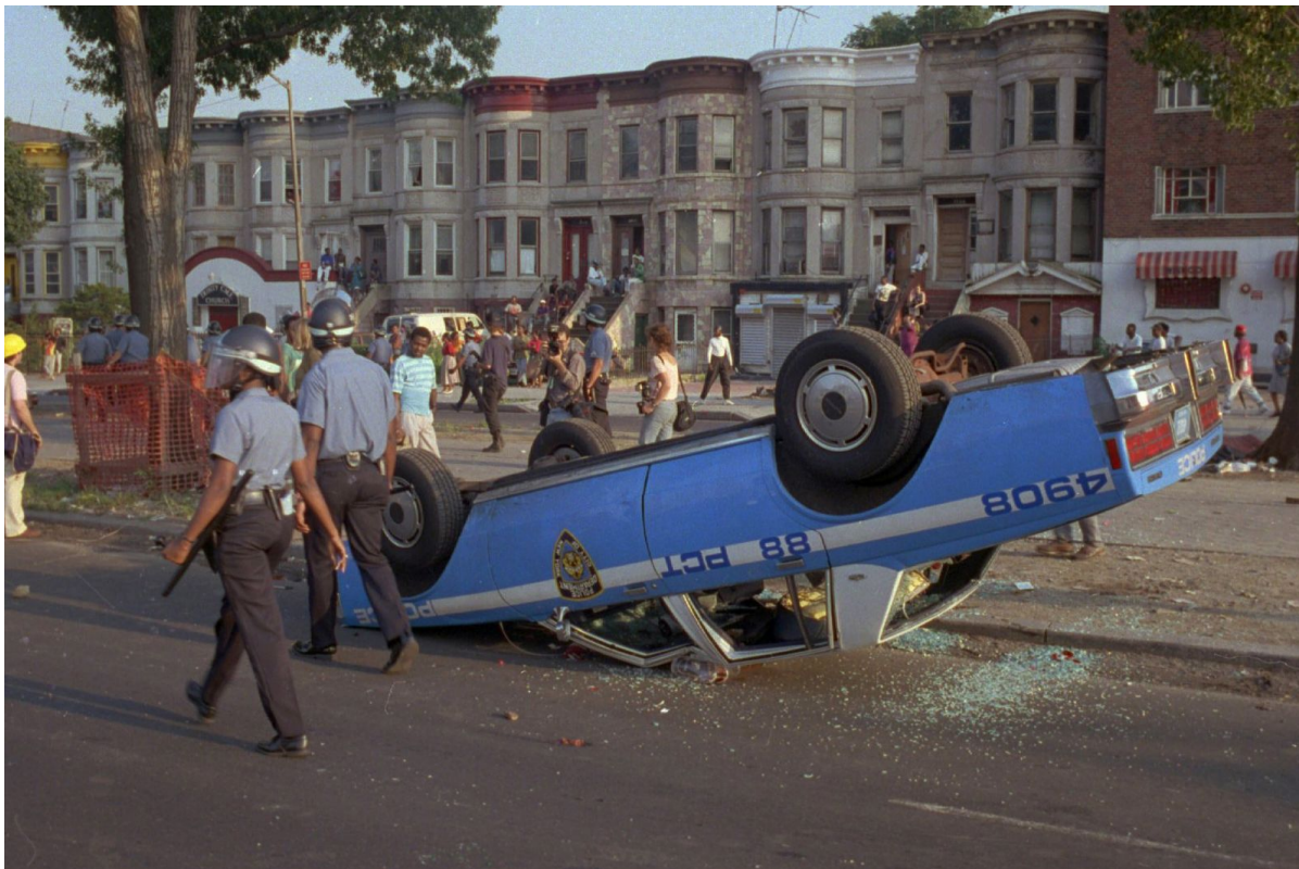
Расовые беспорядки в Краун-Хейтс, 1991

Как в плохом анекдоте, в статье появляется тот самый анекдотический иностранец, приехавший в Россию. Здесь это неназванный профессор, помогавший евреям уехать из СССР, человек, симпатизирующий русскоязычным евреям и любящий их обильно заправленные майонезом закуски. При этом лирический герой вопрошает автора: «Почему они такие расисты?». Все это очень похоже на перелицованный исторический анекдот про Вильгельма Гумбольдта. Этот немецкий просветитель сделал очень много для эмансипации евреев, а в конце жизни признался, что очень любит еврейский народ, но его конкретные представители такие сволочи. Тогда это было смешно, а сегодня является классическим примером антисемитизма.