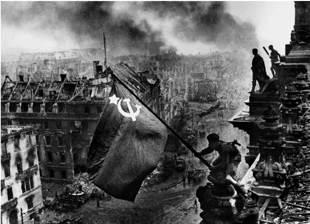
«Знамя победы над Рейхстагом».

Символами победы союзников во Второй мировой войне стали два фото: красное знамя над полуразрушенным Рейхстагом в Берлине и группа американских солдат, устанавливающих американский флаг на Иводзиме. Автор первого снимка — уроженец Юзовки Евгений Халдей. Во время еврейского погрома 13 марта 1918 года были убиты его мать (при попытке защитить сына) и дед, а сам годовалый Женя получил пулевое ранение в грудь. В 13 лет пришел на завод, тогда же увлекся фотографией и в 16 стал фотокором. С 1939 года Халдей — корреспондент «Фотохроники ТАСС». За четыре года войны прошел со своей камерой от Мурманска до Берлина. В историю вошли его кадры с конференции в Потсдаме и подписания акта капитуляции Германии. Фотографии Евгения Халдея были представлены в качестве вещественных доказательств на Нюрнбергском процессе .