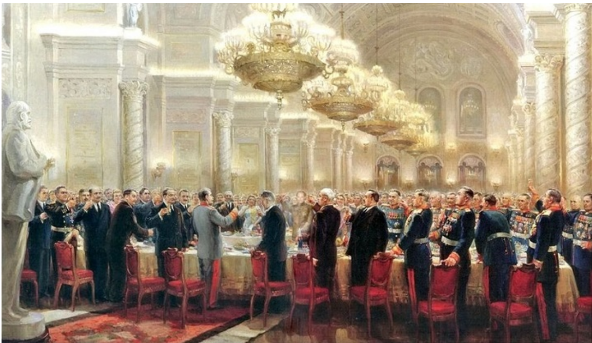
«За великий русский народ», худ. Михаил Хмелько, 1947 год