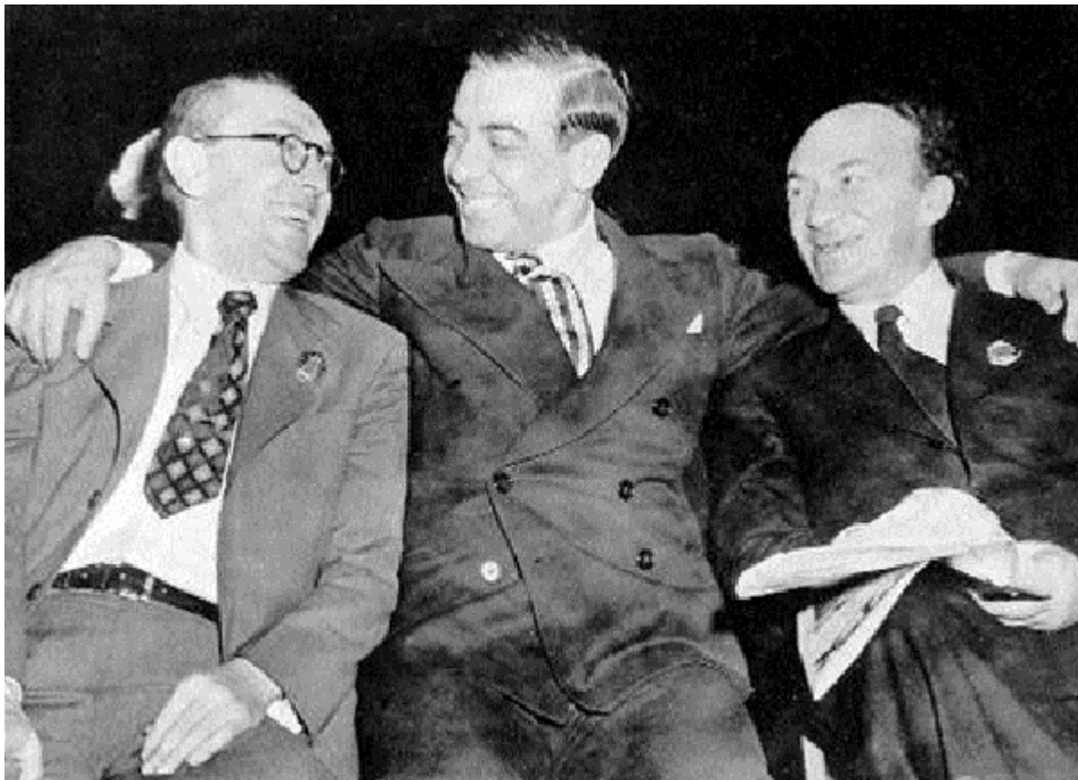
Ицик Фефер и Соломон Михоэлс с актером Эдди Кантором, Голливуд, 1943

имеющего связи с большинством зарубежных глав правительств и мировой финансовой и деловой элитой. В апреле 1945-го это звучит неплохо, но в конце 1948-го это равносильно признанию в преступлении. Весь прошлый опыт ЕАК, включая многомесячное путешествие Михоэлса по США и Канаде, выглядит теперь обвинительным приговором.