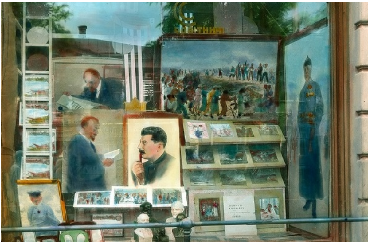
Витрина магазина с портретами и бюстами советских вождей, Одесса, 1930-е

Источники свидетельствуют, что антисемитизм никуда не исчез, просто государство жестко пресекало его проявления. Я как-то наткнулась на донесение ОГПУ конца 1920-х годов — два работника одесского морга с ностальгией вспоминают о погроме 1905 года в Киеве, как подчеркивает агент, смакуя детали. Мол, вышли бы сейчас порезать жидов, но... времена не те. В то же самое время государство пыталось бороться с укоренившимися антисемитскими стереотипами и культивировать позитивный имидж евреев среди населения. Вследствие этих усилий советские евреи стали постепенно восприниматься как «нормальные» советские граждане. После двух десятилетий советской власти для нового поколения национальный вопрос был глубоко периферийным.