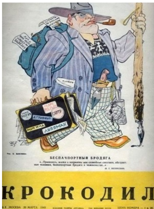
Беспаспортный бродяга, «Крокодил», 1949