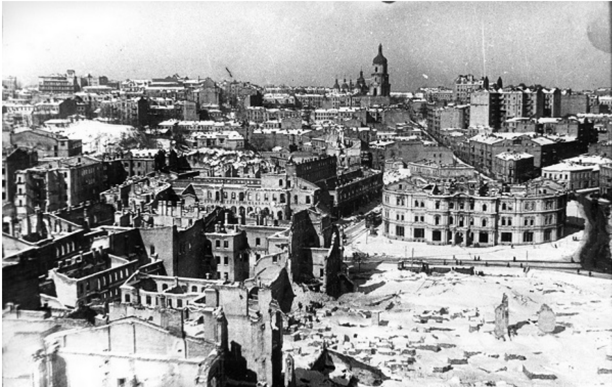
Разрушенный центр Киева, 1944

1944 год. Ветеран-еврей пишет Сталину с фронта, как офицеры СМЕРШ пытались выкинуть его жену с детьми из их квартиры. Те кричали, что женщина взяла этих жидят из детдома, чтобы получить льготы на большую семью. И попутно обвинили ее в получении ордена Красной Звезды через постель. Думаете, они верили в эту чушь? Нет, разумеется. Просто пригодного жилья оставалось очень мало, и в борьбе за него все средства были хороши.