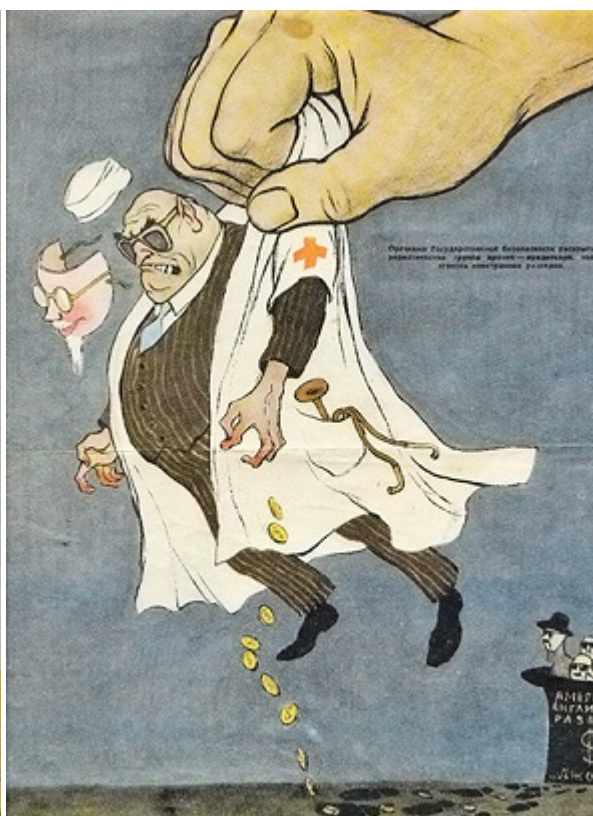
«Следы преступлений» (раскрыта террористическая группа врачей- вредителей), 1953

— Понятно, что в массовом сознании многие евреи воспринимались как не вполне советские люди, но уничтожение еврейской интеллигенции началось с верхушки ЕАК — насквозь советской и преданной Сталину. Что это было — паранойя стареющего диктатора или прагматичный шаг в духе Больших процессов, когда Сталин четко понимал, кого он уничтожает и зачем?