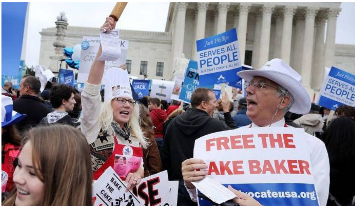
Демонстрация в поддержку Джека Филиппса

Дискуссия об однополых браках в последние десятилетия превратилась в Америке в символ борьбы за гражданские права. За относительно короткое время активисты ЛГБТ добились признания своих прав и победили во всех битвах, которые вели. Верховный суд США постановил, что брак является неотъемлемым правом человека и гражданина, независимо от его сексуальной ориентации. Успехи вдохновили активистов на дальнейшую борьбу.