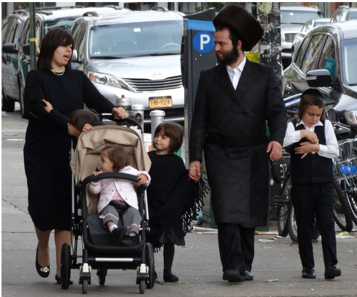
В квартале Боро-парк, Нью-Йорк

Никто не желает сделать шаг назад, чтобы не оказаться в роли проигравших всё и вся. Сторонники антидискриминационных законов часто отрицают важность религиозной свободы, мол, почему бы верующим согражданам не отказаться от архаики, поменять взгляды и встать на путь прогресса. Адепты религиозной свободы не желают считаться с оскорбленным достоинством людей, которых отказываются обслужить, мол, почему бы им не пойти в другой магазин или пекарню. Америка не уникальна в этом. Подобные конфликты не затихают и в Израиле, где вечный еврейский спор по вопросу взаимоотношений государства и религии часто вызывает вспышки напрасной ненависти с обеих сторон.