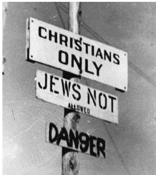
«Только для христиан. Евреям вход запрещен»

Нельзя при этом забывать, что евреи — меньшинство, подвергавшееся в Америке жестокой дискриминации. Заявление «Агудас Исраэль» резонирует с памятью о тех временах, когда евреи в Америке не могли жить в соответствии со своими религиозными убеждениями. Еще в 1950 — 60-х для евреев были закрыты многие сферы большого бизнеса. Еврейских абитуриентов неохотно принимали в престижные колледжи. Евреев-врачей и адвокатов не брали на работу в больницы и юридические фирмы. Приходилось создавать свои собственные фирмы и клиники, быть лучше, чем конкуренты — не евреи. В 1957 году Антидиффамационная лига отмечала, что в 23% гостиниц дискриминируют еврейских постояльцев. В 1964-м этот показатель в