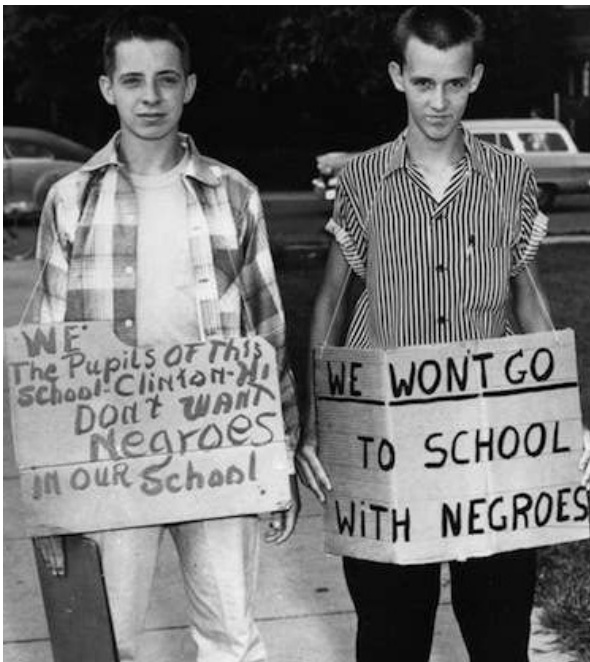
Школьники, протестующие против совместного обучения с афроамериканцами, 1960-е

Иногда евреи проявляли большее единство в защите свободы вероисповедания. В 1963 году все еврейские течения поддержали иск адвентистки седьмого дня, уволенной из-за отказа работать в шабат. Еврейские организации объединились и в поддержке семьи амишей из Висконсина, нарушавших закон штата и отказавшихся из религиозных соображений отправить детей в общественную школу. Еще большее единодушие демонстрировали еврейские организации, когда дело касалось евреев: в 1986-м был единодушно поддержан иск о праве носить кипу в армии; в 2011-м общины единым фронтом выступили против попытки муниципалитета Сан-Франциско запретить обряд обрезания.