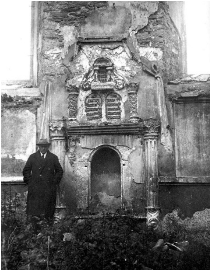
Арон-кодеш синагоги, 1920-е